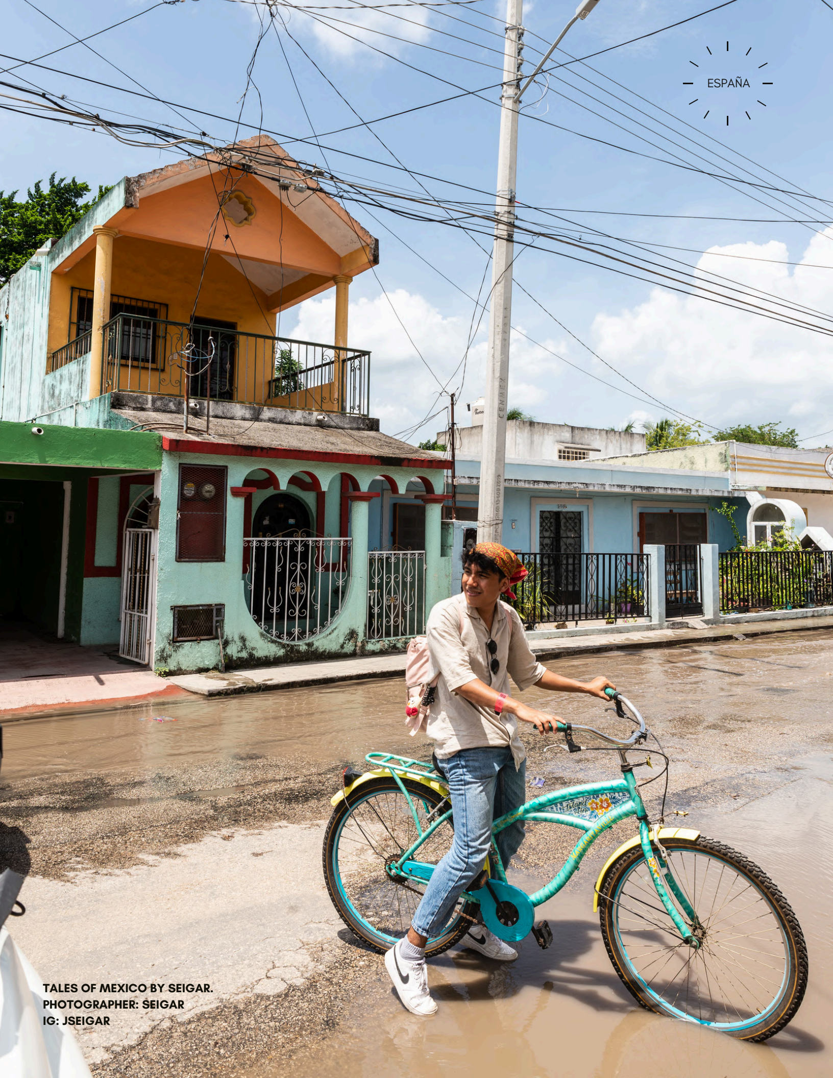
TALES OF MEXICO BY SEIGAR.